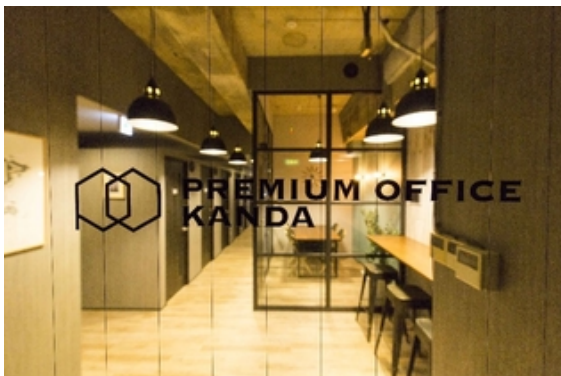
プレミアムオフィス神田