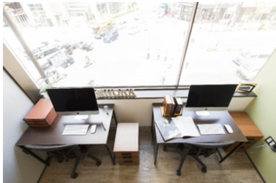
個室オフィス322号室-2