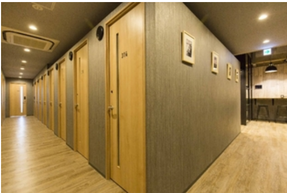
ウェスト・コリドー