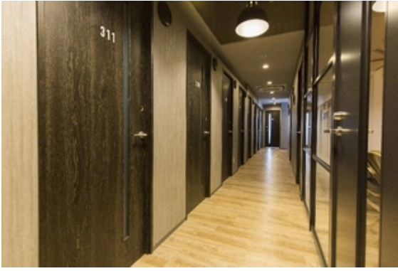
イースト・コリドー