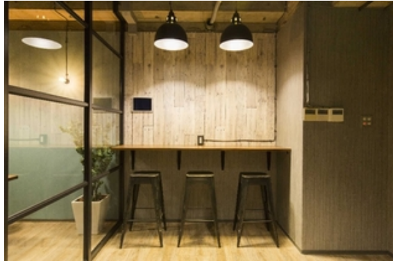
カウンタースペース