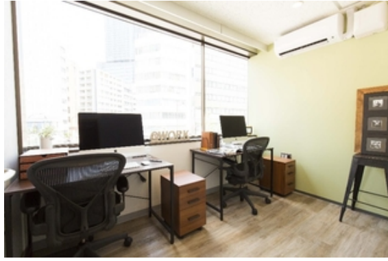
個室オフィス322号室-1