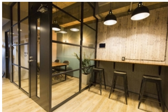
カウンタースペース～ミーティングルーム