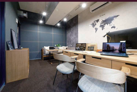
定員 7 名用個室。1 名用～ 7 名用まであります。