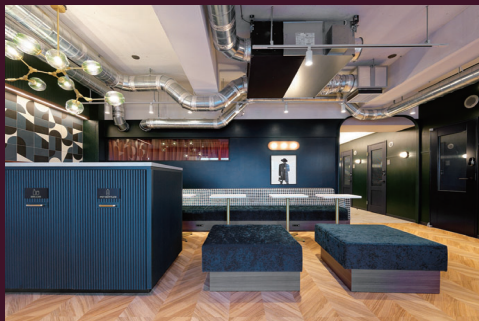
パリのアパルトマンのインテリアスタイル