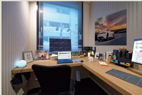
定員 2 名用個室モデルルーム。1 名用～ 5 名用まであります。