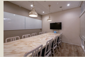
共用会議室 (最大 10 名)