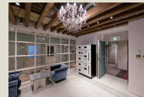
エントランスホール・ロッカー