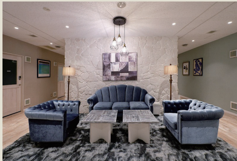
ニューヨークのビーチリゾート「ハンプトンスタイル」のインテリア