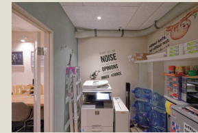
ベンダースペース・複合機等