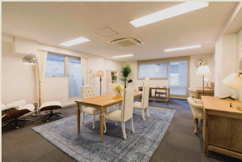
広すぎず狭すぎない適度な広さ。家具は賃貸に含まれません。

会議室やトイレをシェアすることで各室ともフレキシブルなデスクレイアウトが可能。 オフィス家具のセットアップご希望の場合はご相談可能。