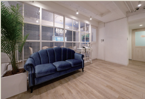
ニューヨークのビーチリゾート「ハンプトンスタイル」のインテリア