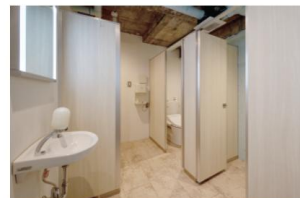
3Fにある女子トイレは洗面台・ブースとも2つ