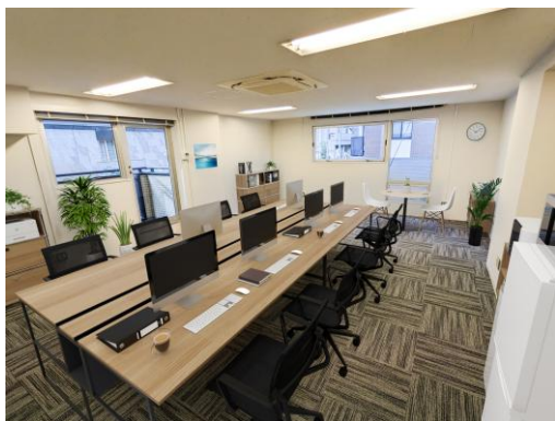
写真はイメージです。家具は賃貸に含まれません。

賃料には、「本建物共用部の維持管理等に要する費用」 「貸室内の照明・空調電気、並びに共用部分の電気・ 水道料」「清掃費用・ゴミ処理費用（粗大ゴミ産業廃 棄物等除く）」を含んでいます。 電話・FAX のみ別途お客様契約（負担）となります。