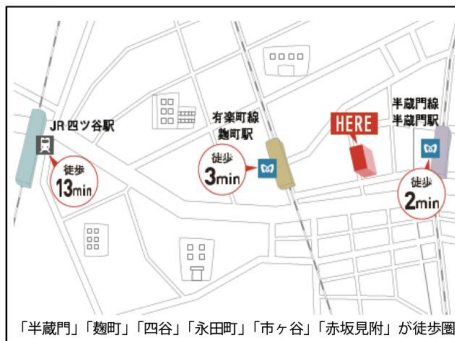
「半蔵門」「麹町」「四谷」「永田町」「市ヶ谷」「赤坂見附」が徒歩圏