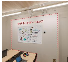
マグネットボードウォール設置