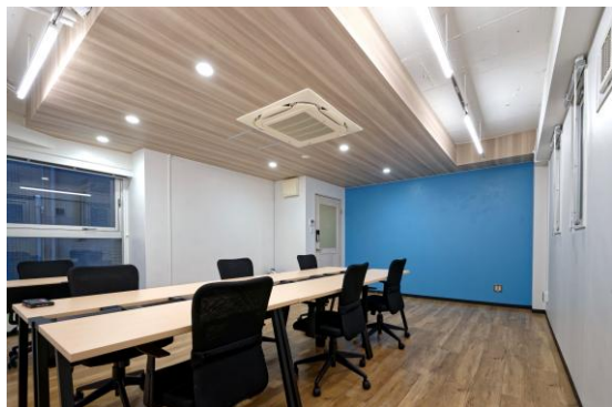
201号室貸室内（什器7セット・有料オプションで9名まで可）