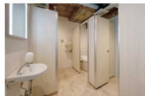
3Fにある女子トイレは洗面台・ブースとも2つ